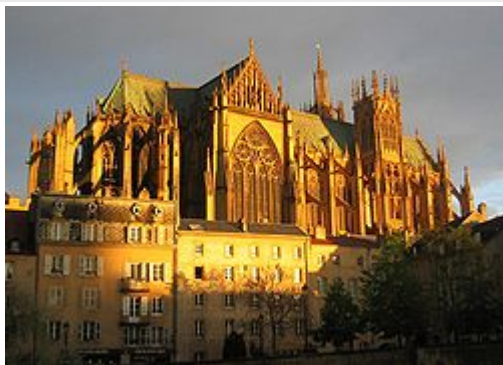
Katedrála sv. Štěpána