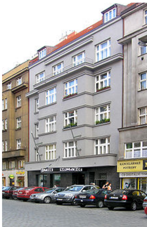
Současná budova v Dejvických

Název tohoto divadla je odvozen od slov SE dm MA lých FO rem, což mělo vyjadřovat původní úmysl zakladatelů věnovat se co nejširšímu spektru uměleckých žánrů (film, poezie, jazz, loutky, tanec, výtvarné umění a hudební komedie). Tento záměr byl prosazován jen v několika sezónách. Později od něj bylo stále více a více upouštěno, protože kladl příliš vysoké nároky na jednotlivé umělce. Bylo založeno roku 1959 skupinou divadelníků a hudebníků soustředěných kolem dvojice Jiří Suchý a Jiří Šlitr . Původní sídlo tohoto divadélka bylo v nynějším Činoherním klubu , ale v roce 1961 se muselo vystěhovat a po několika stěhováních nakonec na delší dobu zakotvilo v divadle v pasáži Alfa , dnešní Stýblově ulici (viz obrázek – dnes už pouze nápis, který zde zůstal, slouží jako upomínka na slavnou éru tohoto divadla ve zdejších prostorách). Po roce 1990 došlo k různým sporům, které přerostly do takových rozměrů, že divadlo opustila jak Šimkova, tak i Dvořákova skupina a v Semaforu zůstala jen skupina původního zakladatele. Roku 1993 se divadlo kvůli restitučním nárokům bývalého majitele domu muselo znovu stěhovat. Po několika přechodných místech se roku 1995 usídlilo v podzemních prostorách Hudebního divadla Karlín . V roce 2002 Prahu zasáhla stoletá voda. Ničivé povodně se bohužel nevyhnuly ani