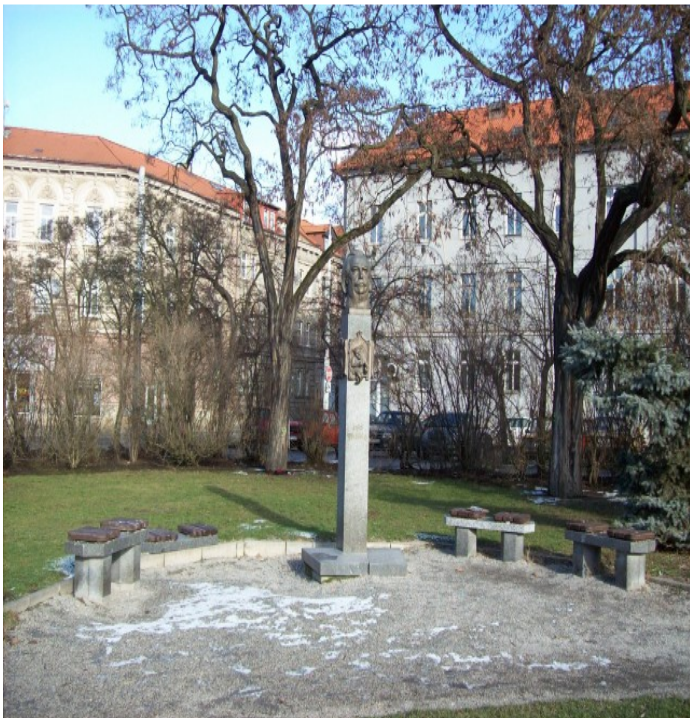
Památník Jiřího Trnky v Plzni

zdroje: http://cs.wikipedia.org/wiki http://www.google.cz/images